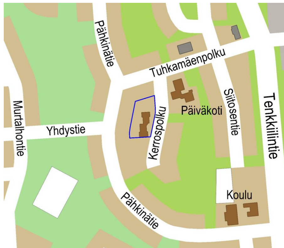
Kuva 1. Suunnittelualueen sijainti on rajattu sinisellä.

Suunnittelualueen sijainti on esitetty alla olevassa karttakuvassa.